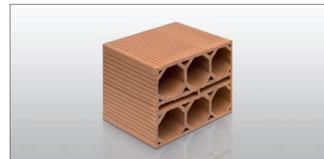
Weinlagerstein für 2 x 3 Flaschen | teilbarer Doppelstein 37,5 cm x 27 cm x 30 cm (B x H x T) Art.-Nr. 31679

Das Besondere an diesem Weinlagerstein ist, dass beim Zusammenstellen von zwei Steinen ein weiteres neuntes Loch entsteht, in dem eine weitere Flasche gelagert werden kann.