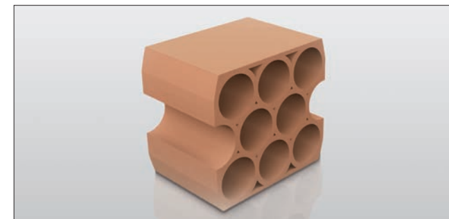
Weinlagerstein für 8 bis 9 Flaschen 35 cm x 31,5 cm x 24 cm (B x H x T) Art.-Nr. 31682

Diesen Weinlagerstein kann man optimal stapeln egal ob hochkant, quer oder um 180° gedreht. Die wabenförmige Struktur dieses Steines lässt das Weinregal oder das Weinlagersystem modern und frisch erscheinen.