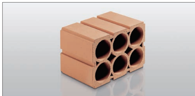
Weinlagerstein für 6 Flaschen 36,5 cm x 25 cm x 23 cm (B x H x T) Art.-Nr. 31683

Die Ziegel sind problemlos bis auf Kellergeschosshöhe stapelbar. Es sind zahlreiche Aufbauvarianten für Wohn- und Kellerbereich möglich. Lassen Sie sich inspirieren!